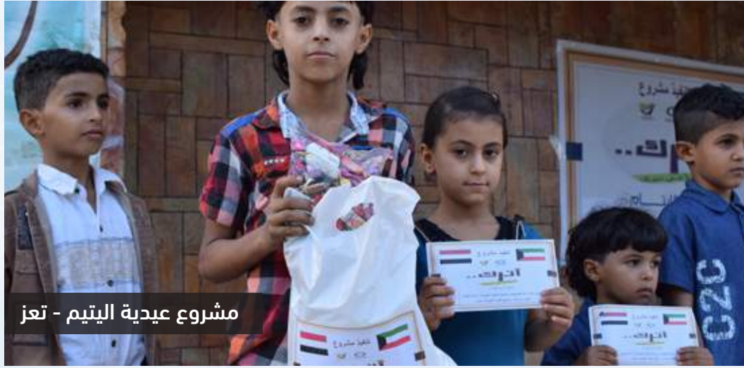
مشروع عيدية اليتيم - تعز