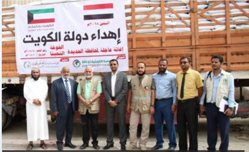
تدشين الإغاثة العاجلة بحضور محافظ الحديدة ورئيس لجنة الإغاثة في الجمعية الكويتية للإغاثة