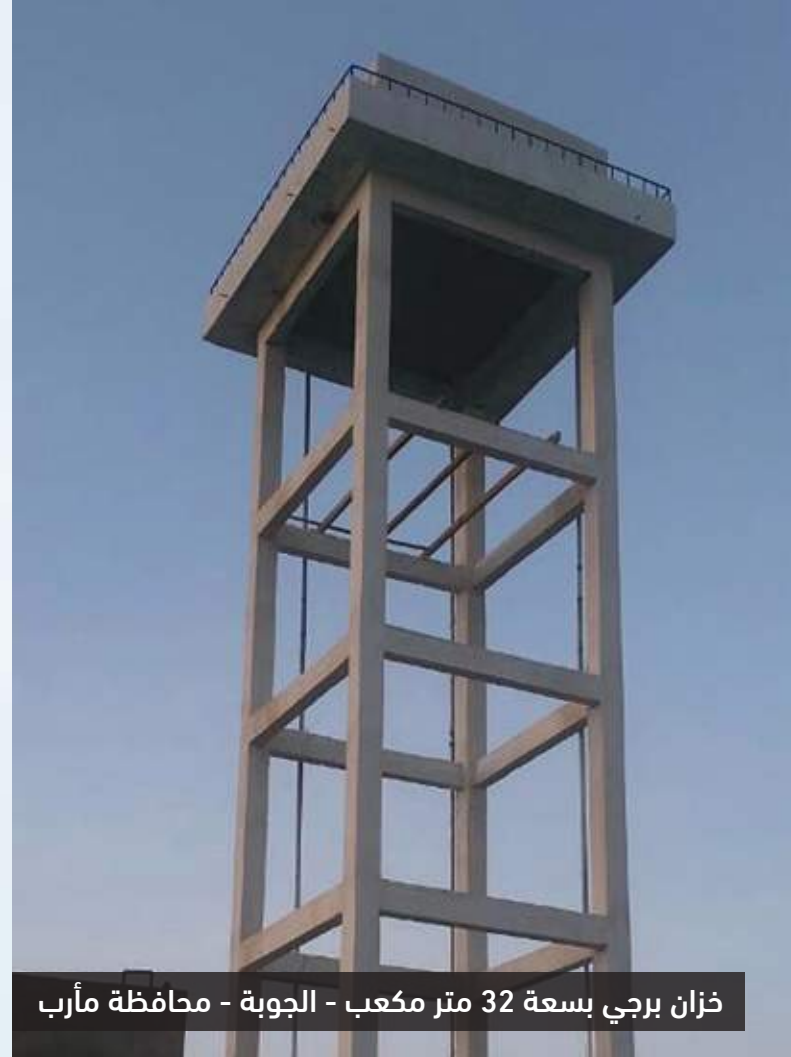
خزان برجي بسعة 32 متر مكعب - الجوبة - محافظة مأرب