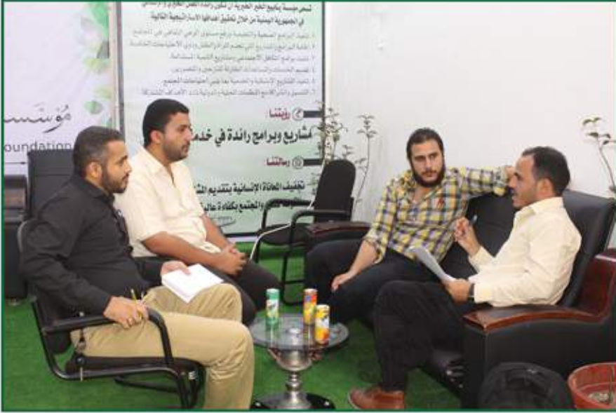
إشراك المؤسسة في نظام الحكومة المقدم من منظمة GIZ الألمانية