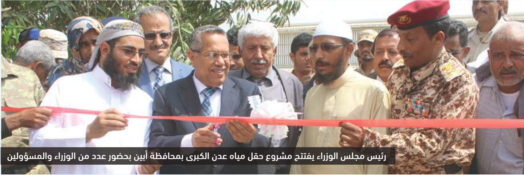
رئيس مجلس الوزراء يفتتح مشروع حقل مياه عدن الكبرى بمحافظة أبين بحضور عدد من الوزراء والمسؤولين