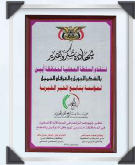
درع السلطة المحلية في محافظة أربيل