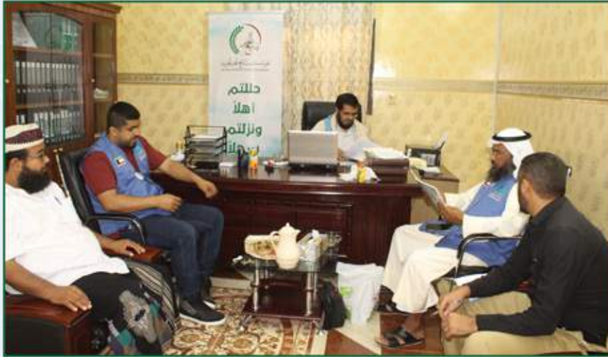
توقيع إتفاقية شريك منفذ لجمعية المنابر القرآنية - دولة الكويت