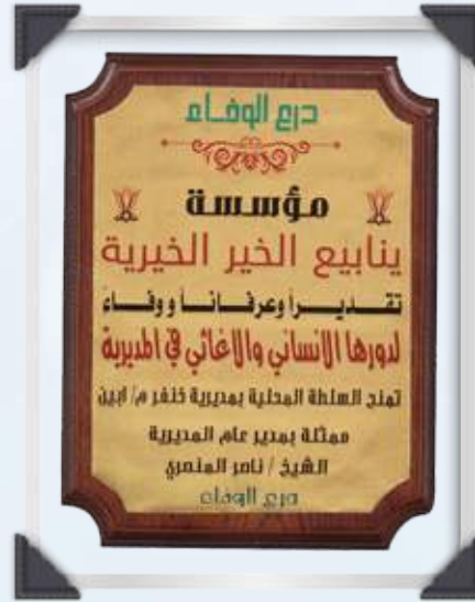
درع مدير مديرية خنفر - محافظة أربيل