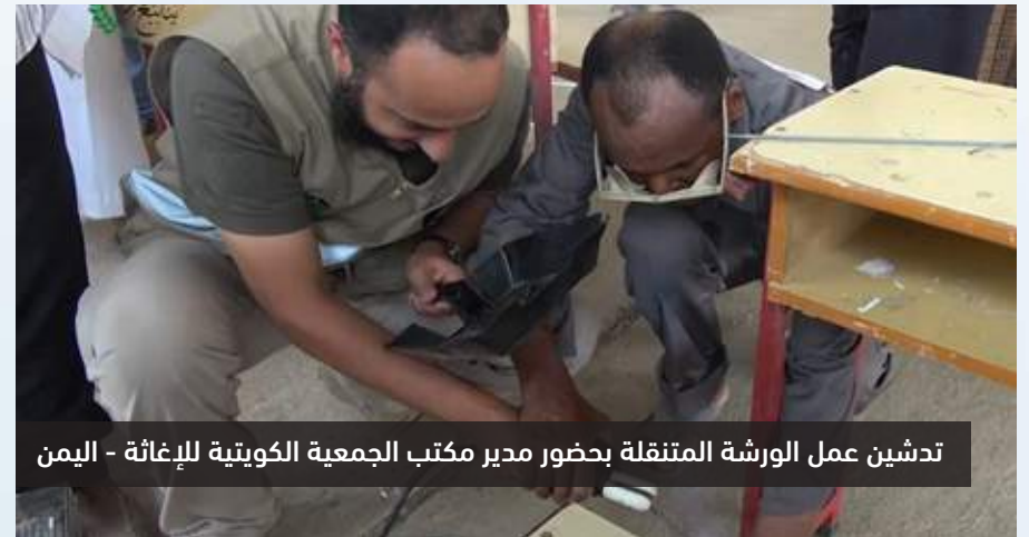
تدشين عمل الورشة المتنقلة بحضور مدير مكتب الجمعية الكويتية للإغاثة - اليمن