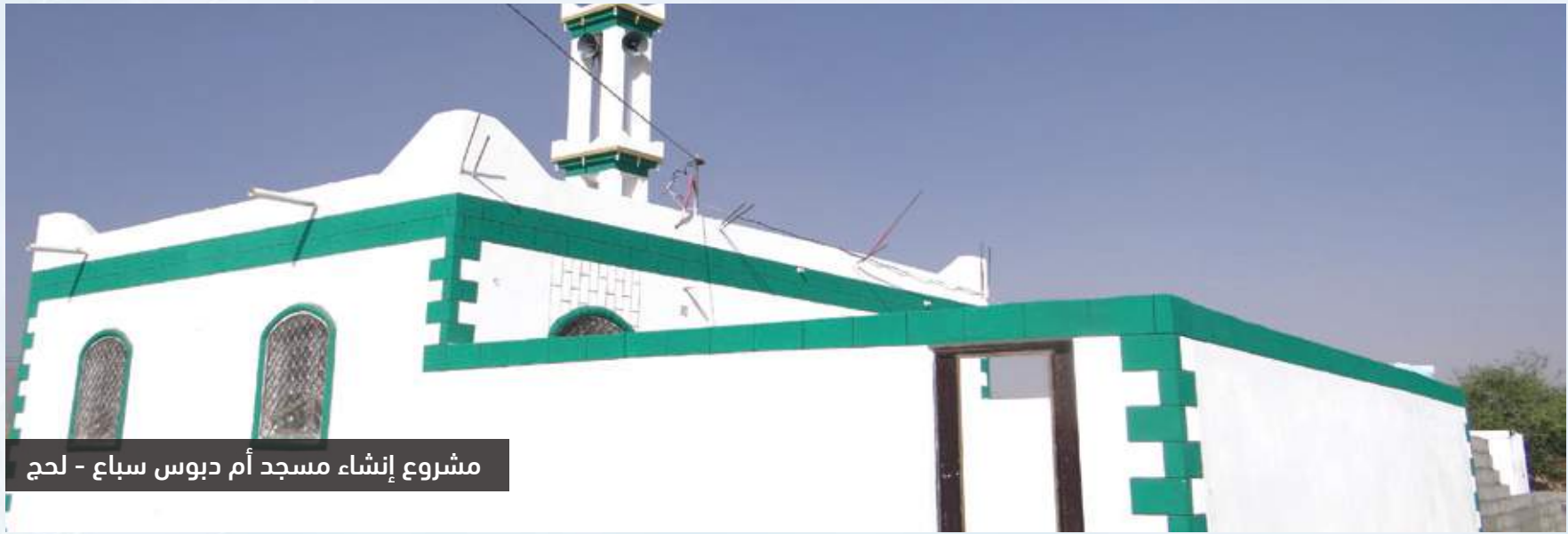
مشروع إنشاء مسجد أم دبوس سباع - لحج