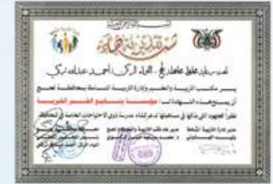
شهادة تقديرية من مكتب التربية والتعليم ومدرسة التربية لتعليمه محافظة لحج