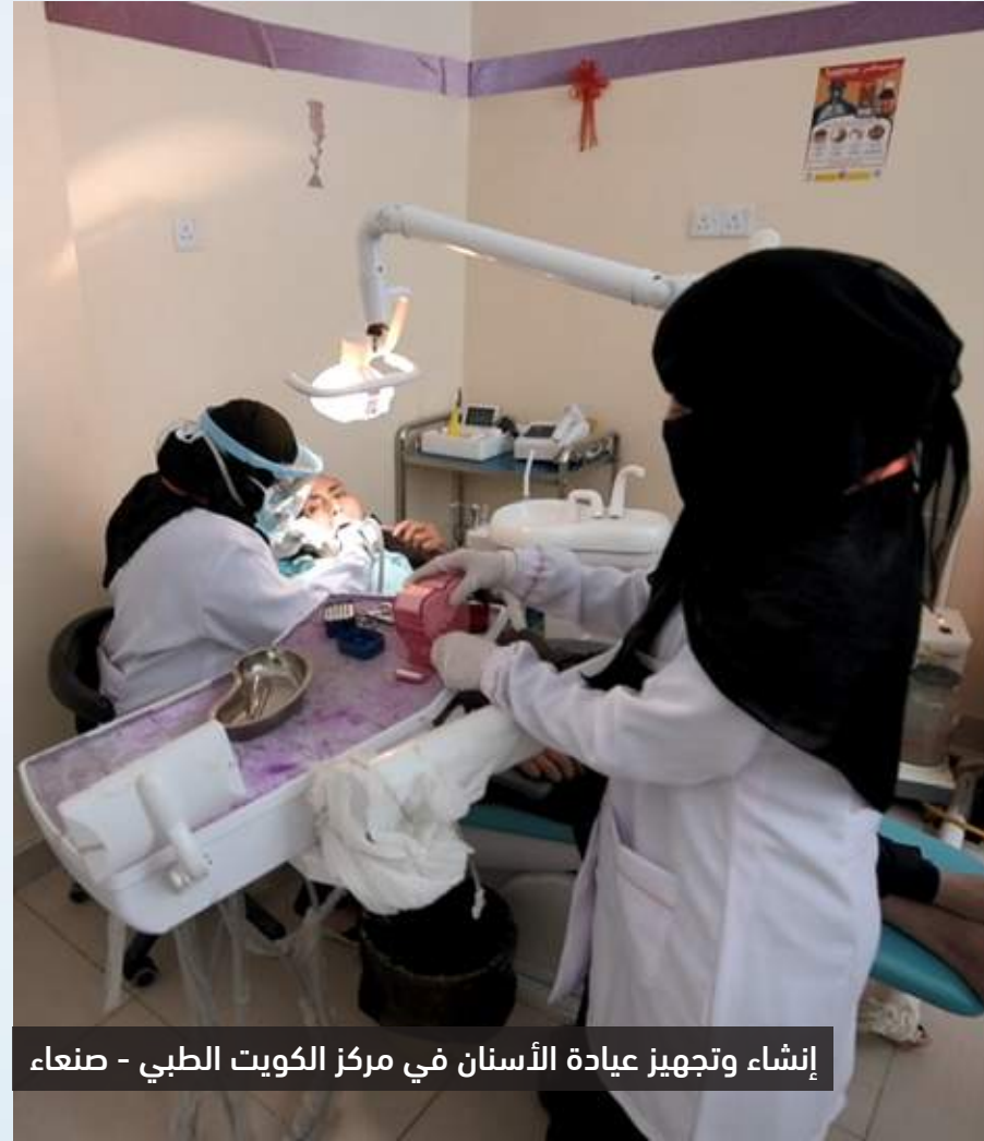
إنشاء وتجهيز عيادة الأسنان في مركز الكويت الطبي - صنعاء