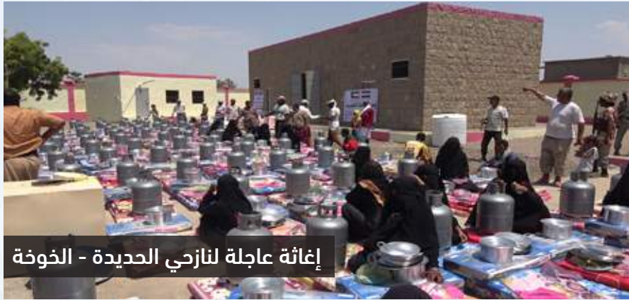
إغاثة عاجلة لنازحي الحديدة - الخوخة