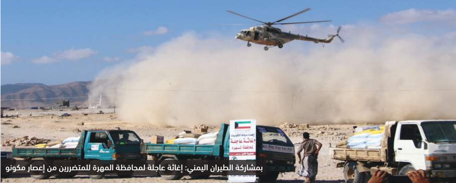
بمشاركة الطيران اليمني: إغاثة عاجلة لمحافظة المهرة للمتضررين من إعصار مكنو