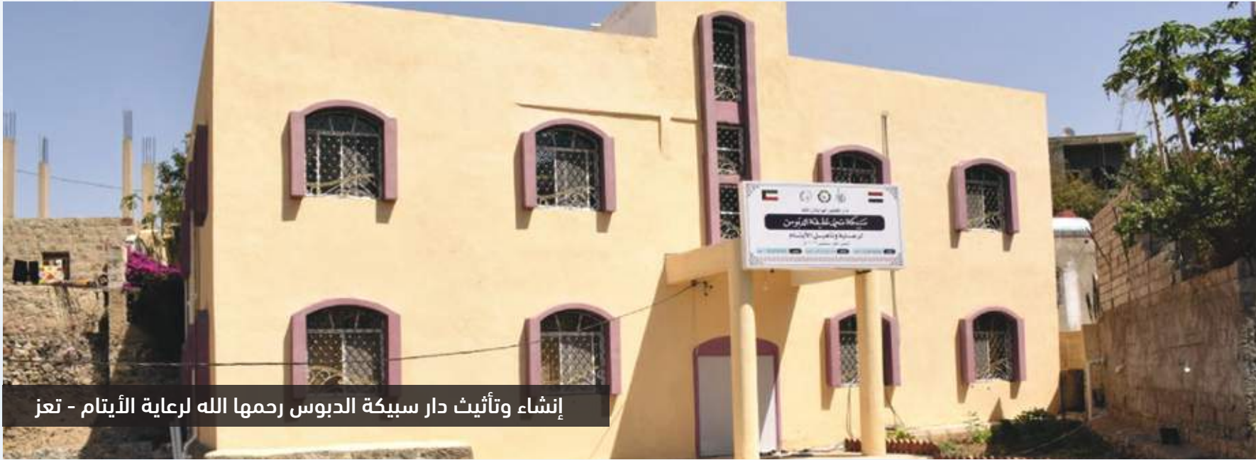
إنشاء وتأثيث دار سبيكة الدبوس رحمة الله لرعاية الأيتام - تعز