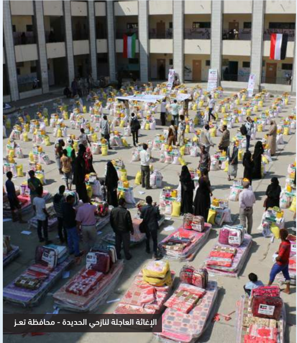
الإغاثة العاجلة لنازحي الحديدة - محافظة تعز