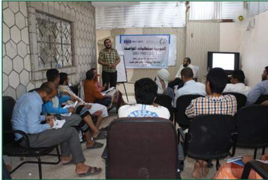
دورة التوعية بمتطلبات المواصفة ISO 9001:2015