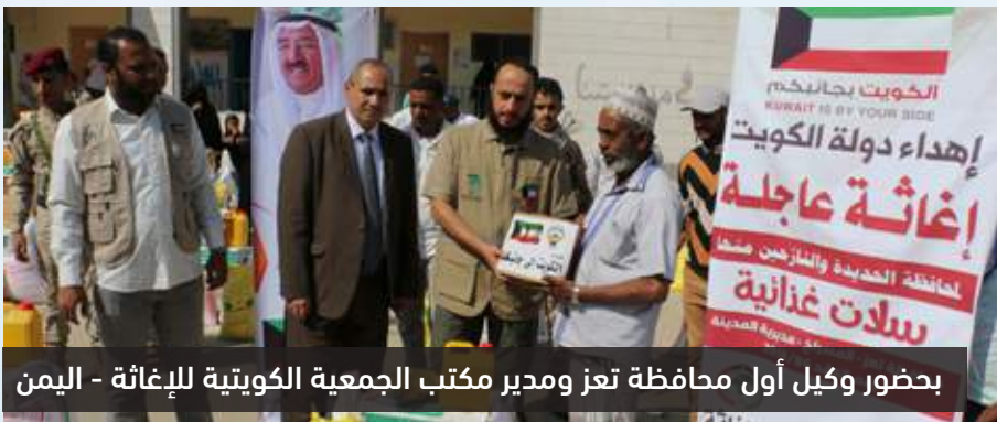
بحضور وكيل أول محافظة تعز ومدير مكتب الجمعية الكويتية للإغاثة - اليمن