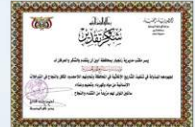
شهادة تقديرية من مكتب مديرية زنجبار / محافظة أريت الاستاذ / احمد وصال احمد