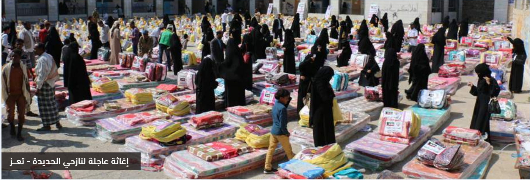
إغاثة عاجلة لنازحي الحديدة - تعز