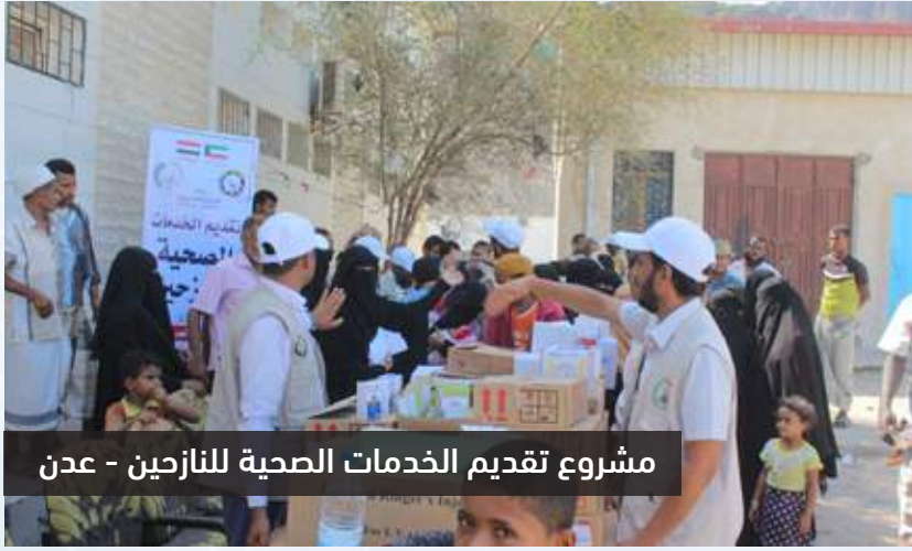
مشروع تقديم الخدمات الصحية للنازحين - عدن