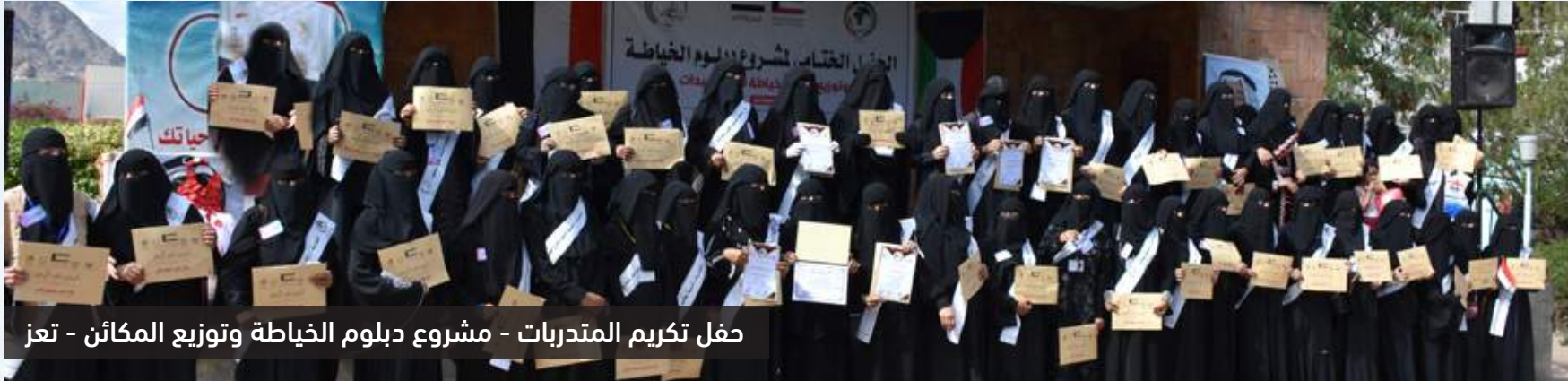
حفل تكريم المتدربات - مشروع دبلوم الخياطة وتوزيع المكائن - تعز