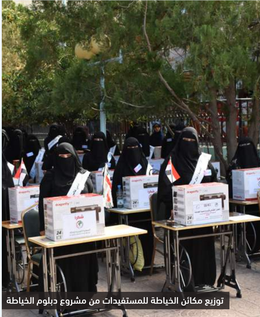
توزيع مكائن الخياطة للمستفيدات من مشروع دبلوم الخياطة