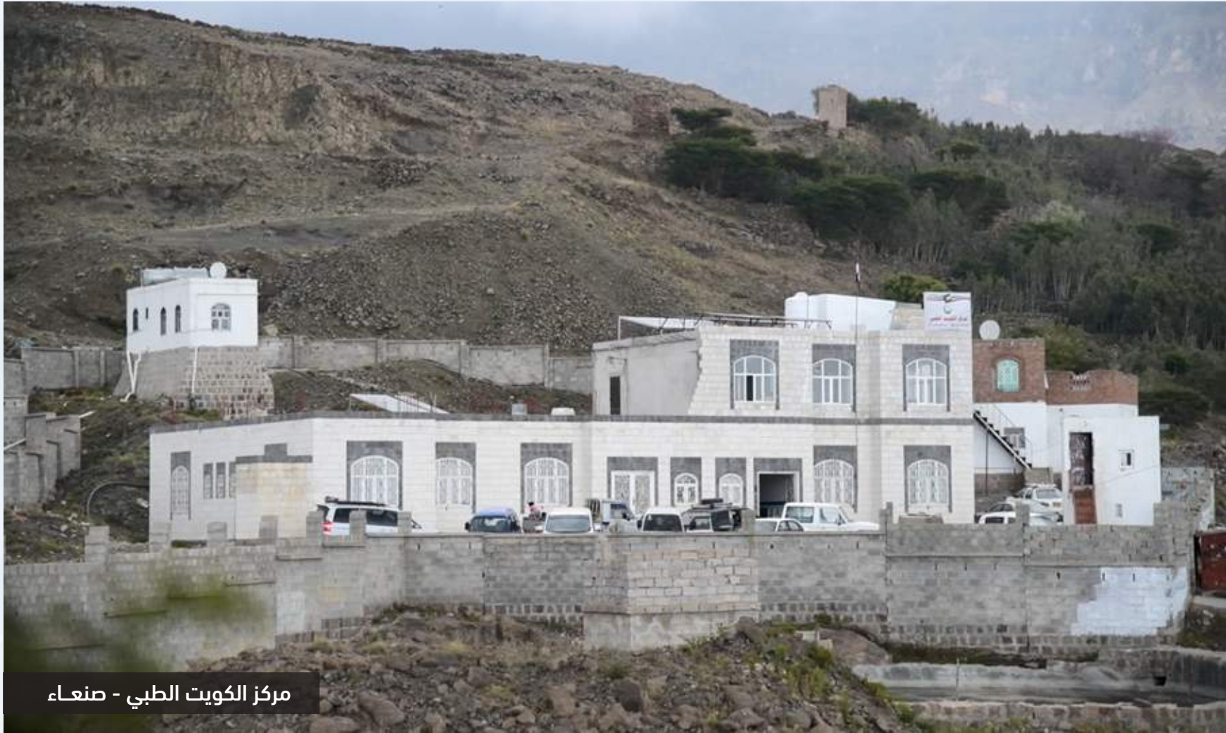
مركز الكويت الطبي - صنعاء