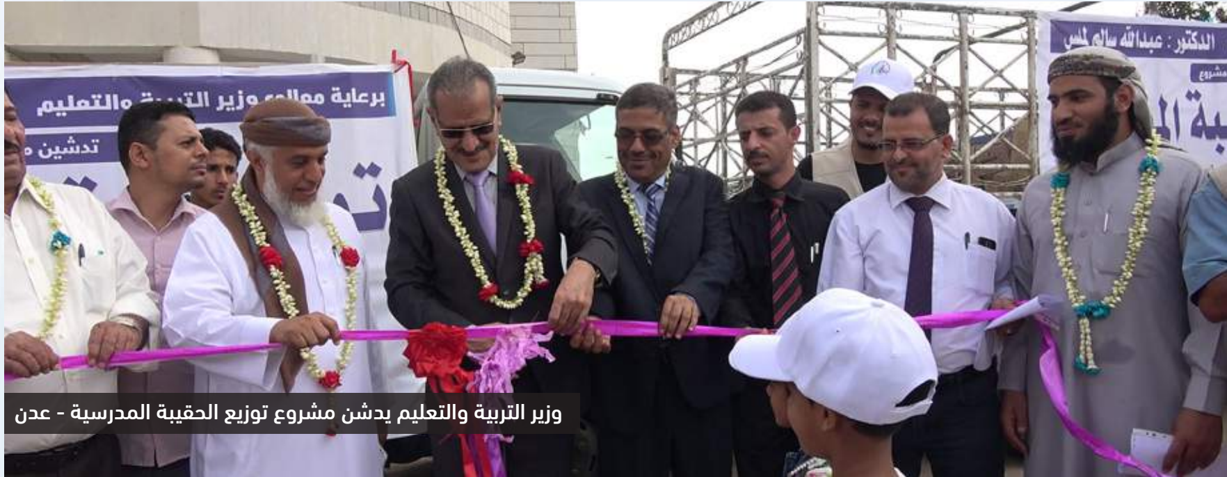
وزير التربية والتعليم يدشن مشروع توزيع الحقبة المدرسية - عدن