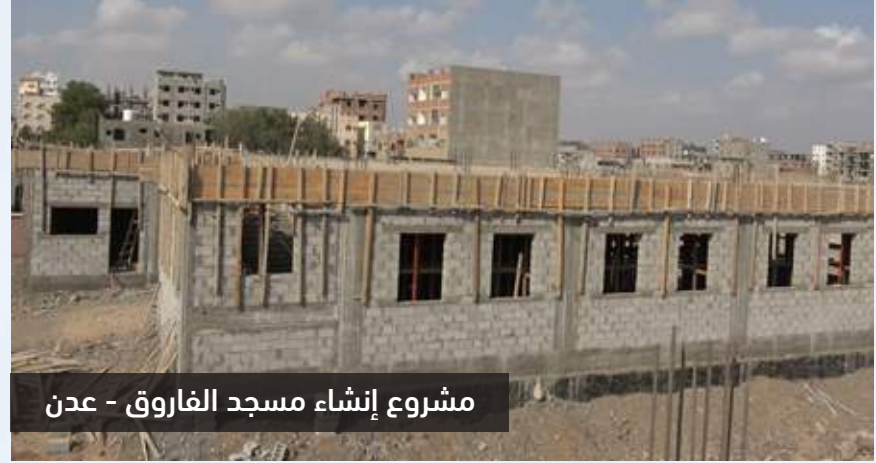
مشروع إنشاء مسجد الفاروق - عدن