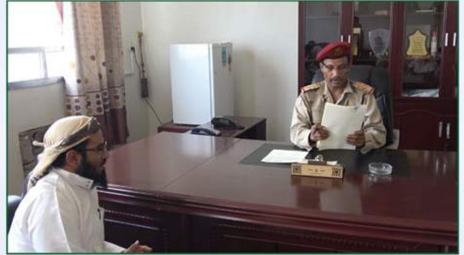
توقيع إتفاقية ترميم المنازل المتضررة من الحرب في محافظة أبين مع محافظ محافظة أبين اللواء ركن/ أبو بكر حسين سالم