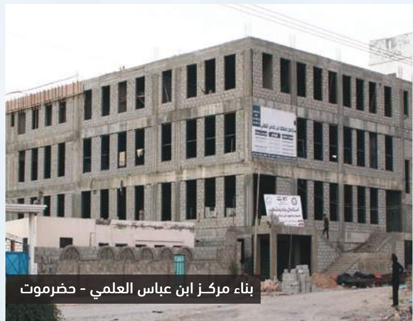
بناء مركز ابن عباس العلمي - حضرموت