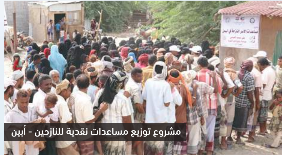
مشروع توزيع مساعدات نقدية للنازحين - أبين