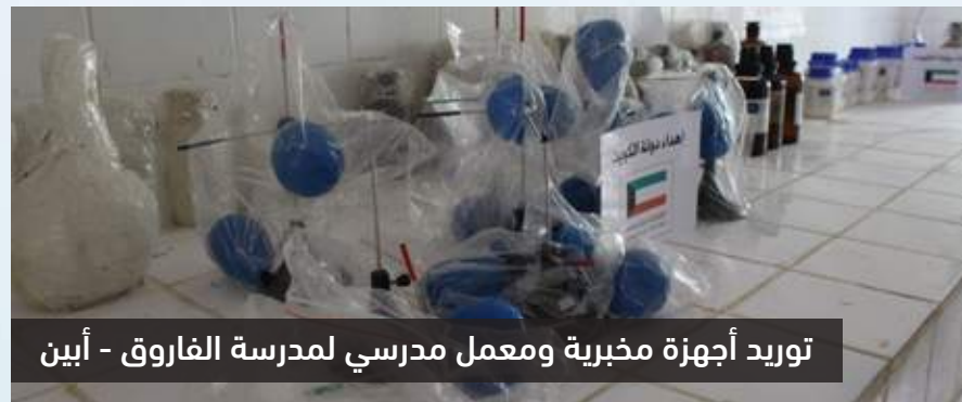
توريد أجهزة مخبرية ومعامل مدرسي لمدرسة الفاروق - أبين