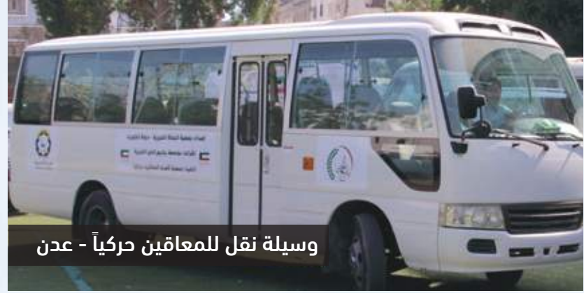
وسيلة نقل للمعاقين حركياً - عدن