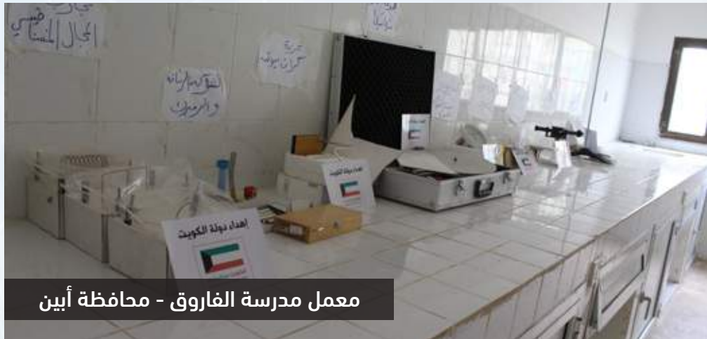
معمل مدرسة الفاروق - محافظة أبين