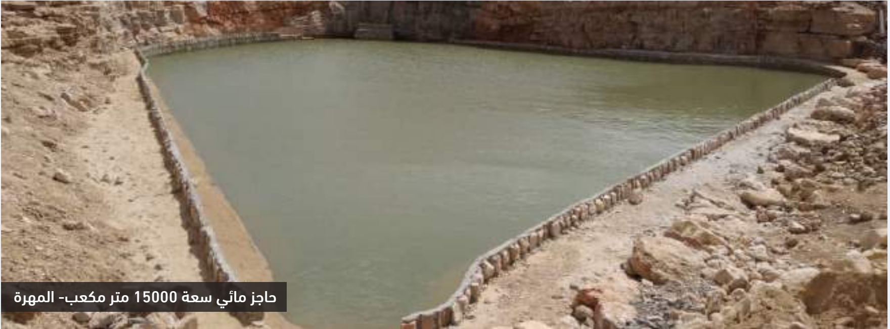
حاجز مائي سعة 15000 متر مكعب- المهرة