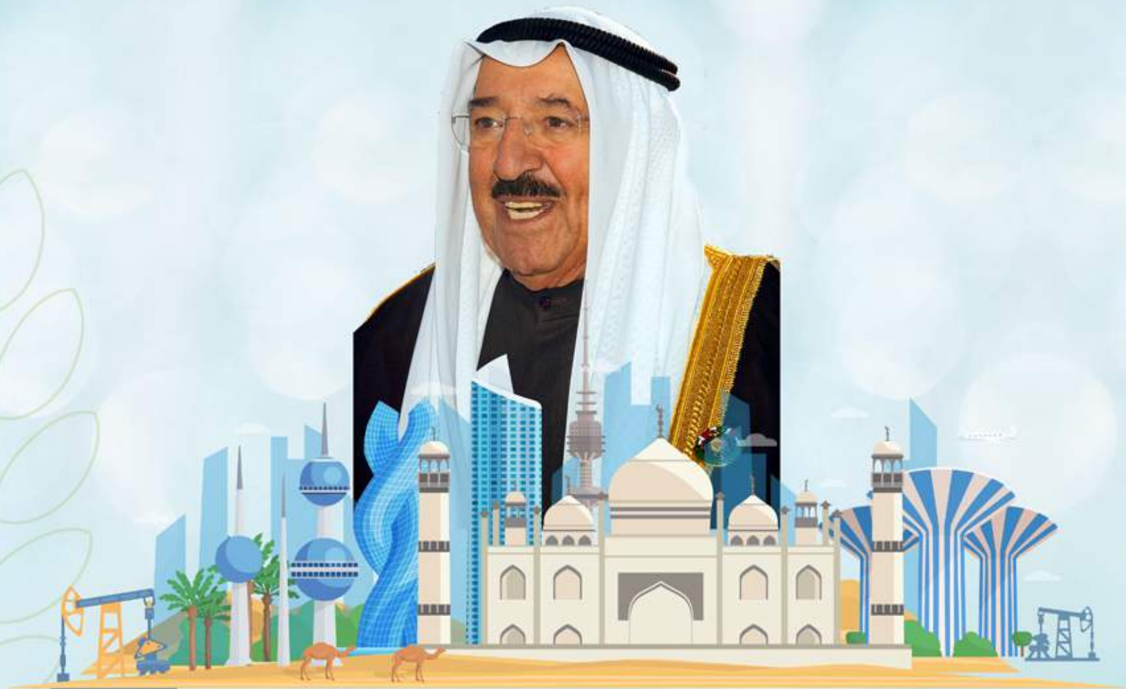
الشيخ/ صباح الأحمد الجابر الصباح أمير دولة الكويت