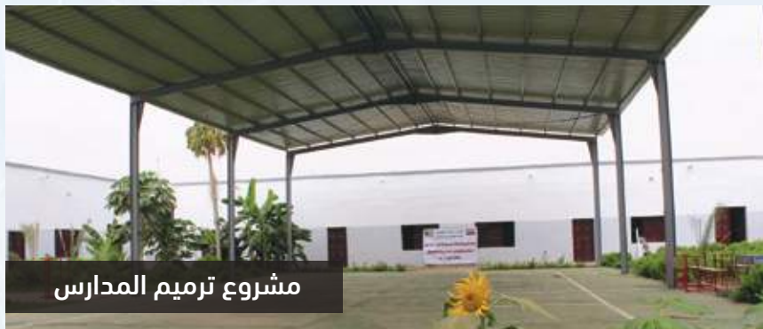
مشروع ترميم المدارس