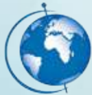
الجمعية الكويتية للتواصل الحضاري