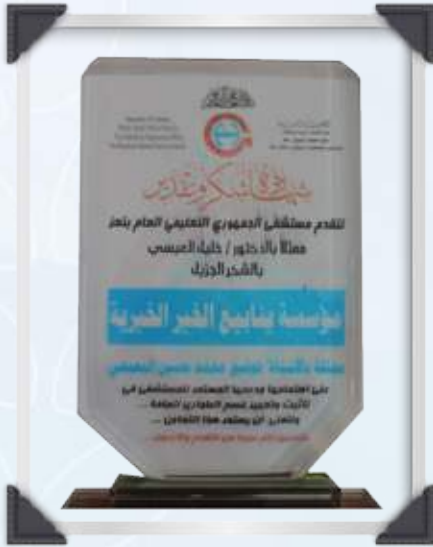
درع مقدم من المستشفى الجمهوري محافظة نمر