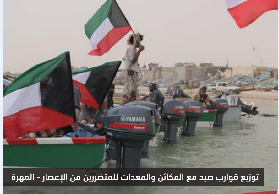
توزيع قوارب صيد مع المكائن والمعدات للمتضررين من الإعصار - المهرة