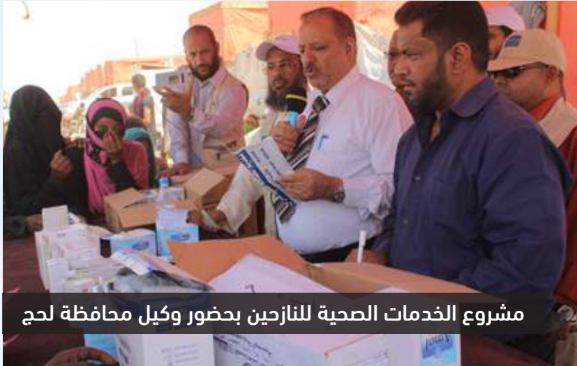
مشروع الخدمات الصحية للنازحين بحضور وكيل محافظة لحج