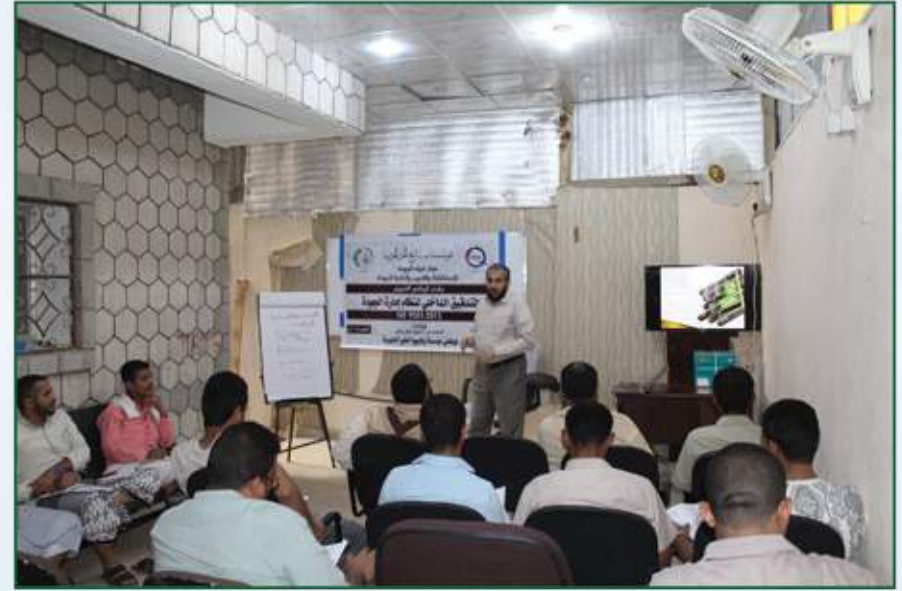
دورة التدقيق الداخلي لنظام إدارة الجودة ISO 9001:2015