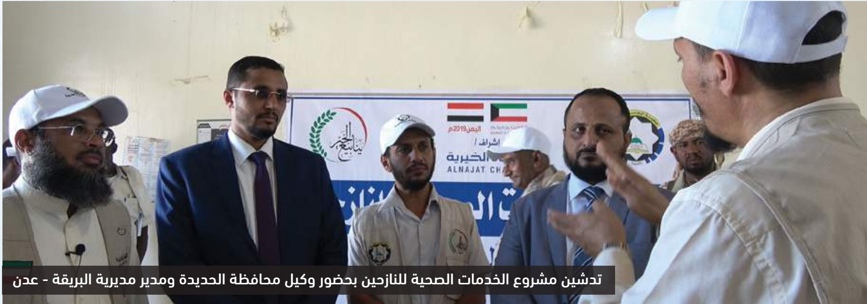
تدشين مشروع الخدمات الصحية للنازحين بحضور وكيل محافظة الحديدة ومدير مديرية البريقة - عدن